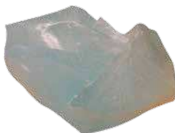
Liant silicate de potassium